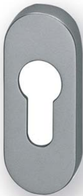
Drückermodell 2254 mit D8-Rosetten in F1-SAT GEOS-Preise ab Seite 274 WG4-Preise ab Seite 284

Ein hochovaler Drücker, sich leicht verjüngend – so lässt sich das Modell 2200 ganz einfach beschreiben. Dieses unauffällig-elegante Design macht das Modell 2200 zu einem Geheimtipp im GEOS-Programm und besonders auch für Objektsanierungen interessant.