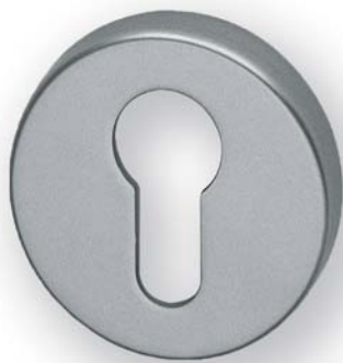
Modell 2352/D6/55Z F-SAT Preise Seite 309

Design: GRUNDMANN (nach einem Entwurf für die Schweizer Eisenbahnen)