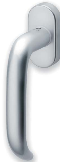
Halbolive Modell 2304HA F1-SAT mit 90° Rasterung Preise Seite 309