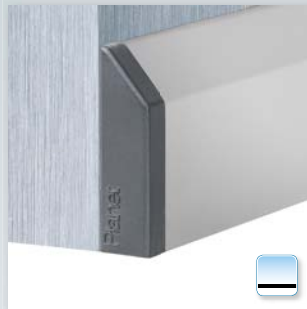
Option: Planet KG-S schmal, seitlich geklebt auf Metall tür