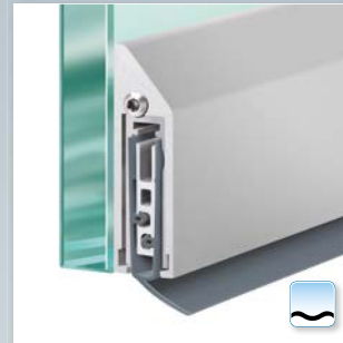
Option: Planet KG-S schmal, Schräglippe für wellige Böden