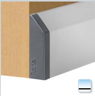
Option: Planet KG-S schmal, seitlich geklebt auf Holz tür