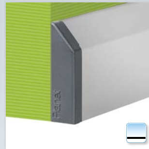
Option: Planet KG-S schmal, seitlich geklebt auf PVC-Türen