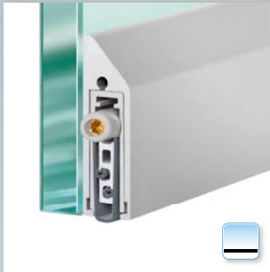
Planet KG-S schmal, seitlich geklebt auf Glastür, Auslösesseite