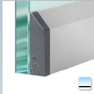
Planet KG-S schmal, mit Abdeckplatte