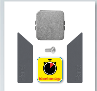
Zubehör: Planet Auflaufplättchen, Befestigungsschraube für Dichtung und Abdeckplatten-Set